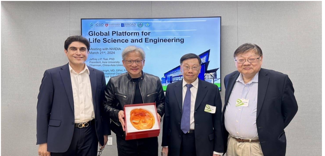
圖：亞大校長蔡進發（右 2）、美國哈佛大學醫學院 Alireza Haghighi 教授（右 4）、黃光彩講座教授（右 1），前往 NVIDIA 總部，與 NVIDIA 創辦人黃仁勳（右 3），針對智慧醫療領域深入交流。