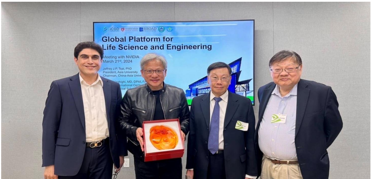
圖：亞大校長蔡進發(右 2)、美國哈佛大學醫學院 Alireza Haghghi 教授(右 4)、黃光彩講座教授(右 1)，前往 NVIDIA 總部，與 NVIDIA 創辦人黃仁勳(右 3)，針對智慧醫療領域深入交流。