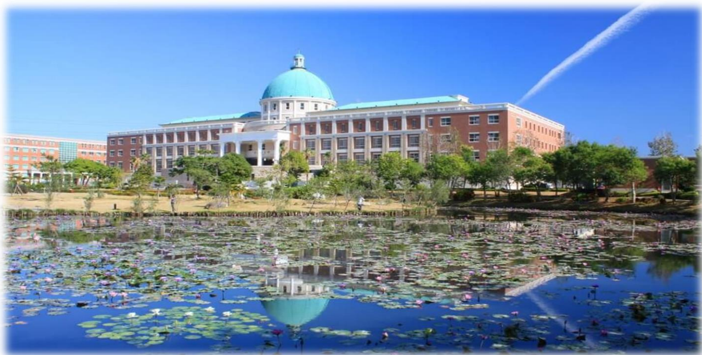
圖：就讀亞大，就是就讀一所「綜合大學」+「醫學大學」+「國際大學」