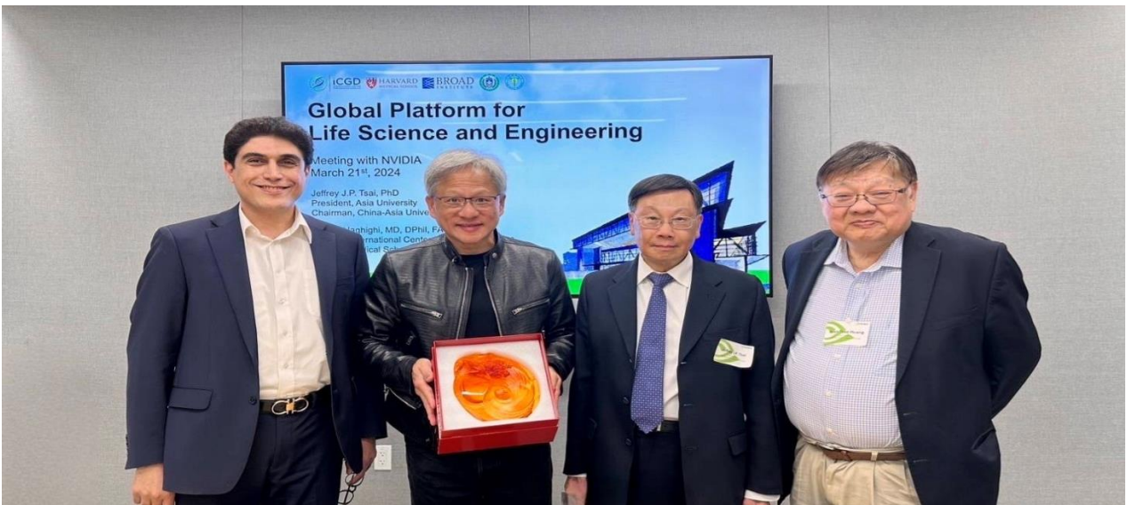
圖：亞大校長蔡進發(右 2)、美國哈佛大學醫學院 Alireza Haghghi 教授(右 4)、黃光彩講座教授(右 1)，前往 NVIDIA 總部，與 NVIDIA 創辦人黃仁勳(右 3)，針對智慧醫療領域深入交流。