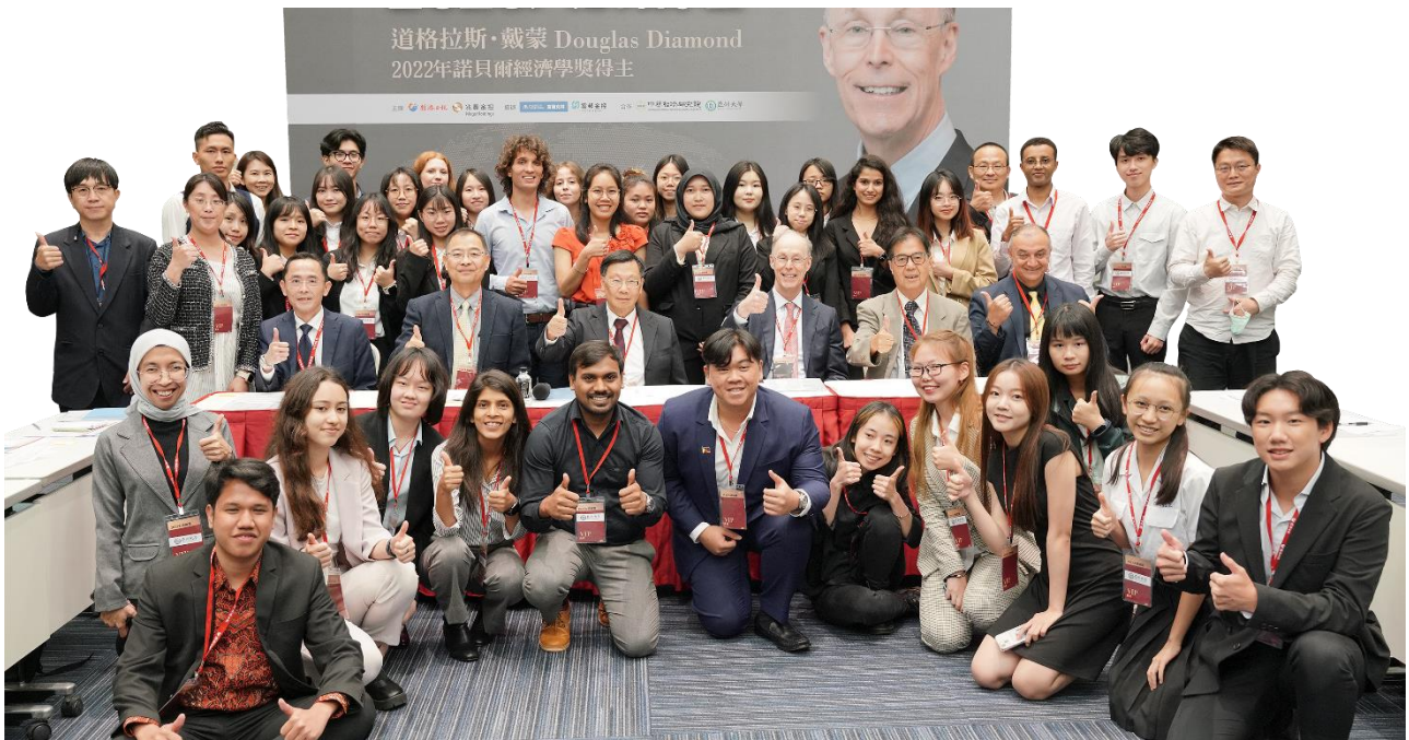
圖：禮聘多位國際級大師蒞校講學，師生可親自向大師請益!每年定期邀請諾貝爾得獎者舉辦大師論壇。