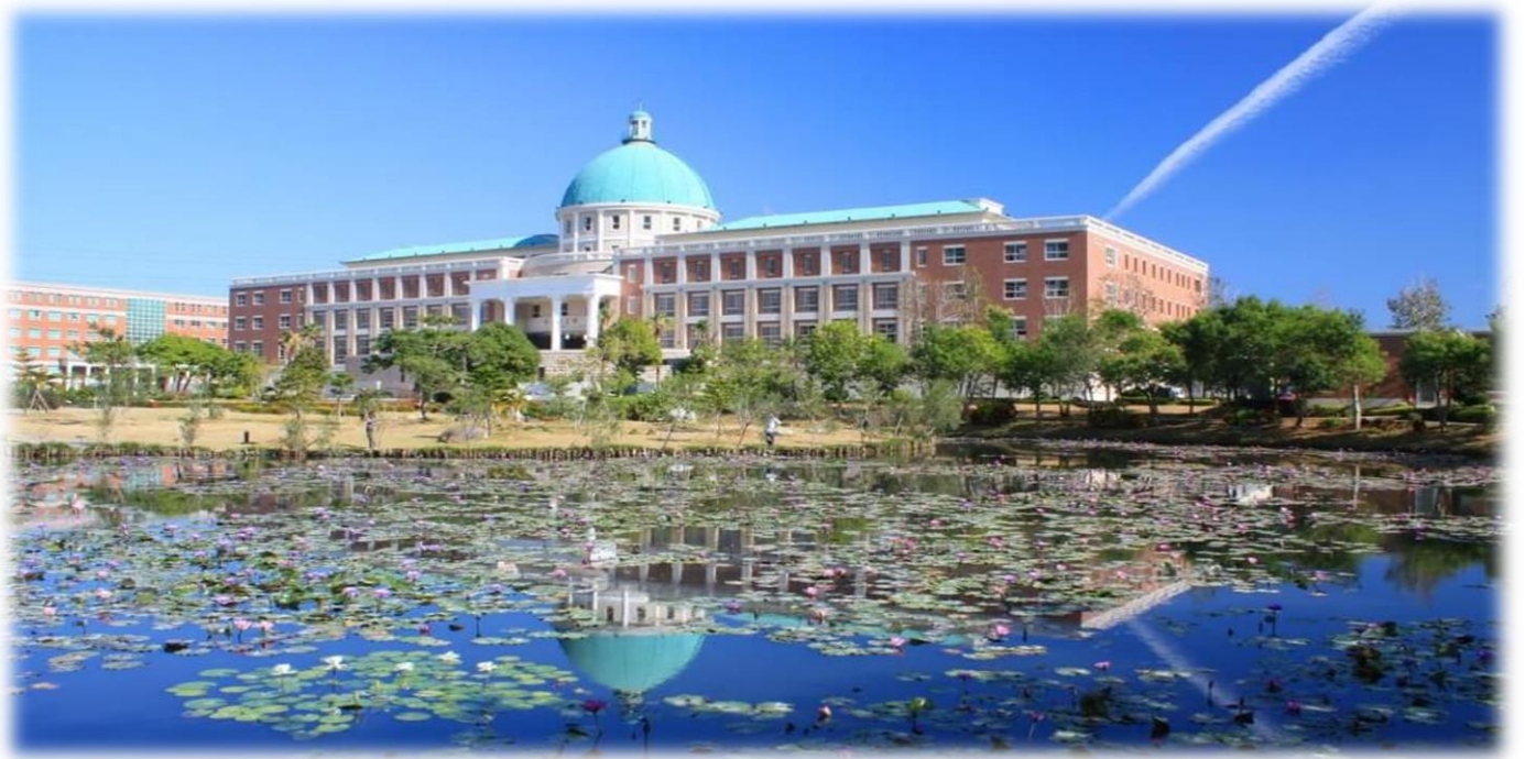
圖：就讀亞大，就是就讀一所「綜合大學」+「醫學大學」+「國際大學」