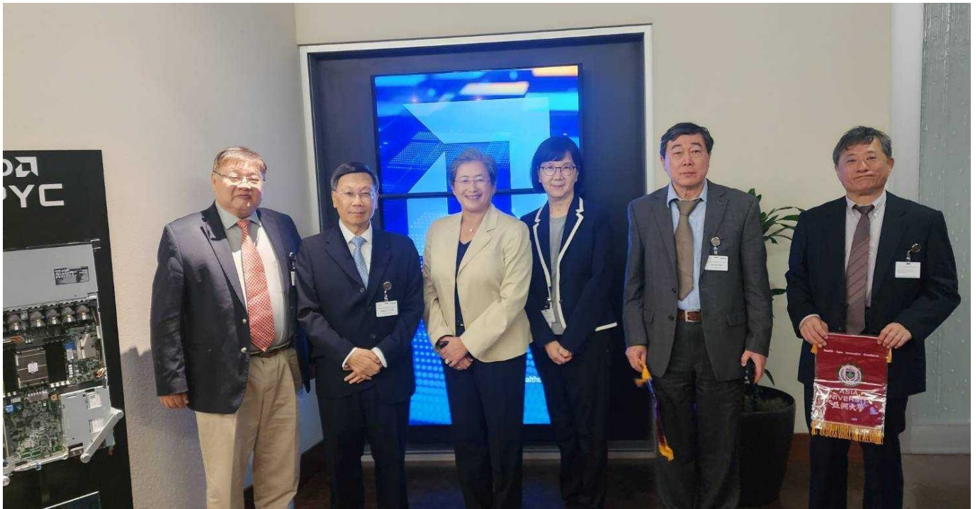
圖：亞大校長蔡進發（左 2）暨夫人（左 4），與黃光彩（左 1）、薛榮銀（左 5）講座教授及資電學院副院長張文鐘（左 6）等，參訪美國 AMD 超微半導體公司，與美國 AMD 董事長兼執行長蘇姿丰博士（左 3）合影