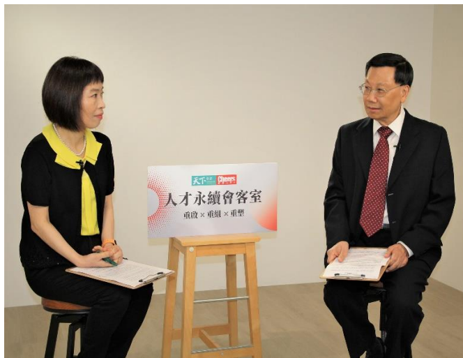
圖：亞洲大學校長蔡進發，接受天下 Cheers 人才會客室專訪。