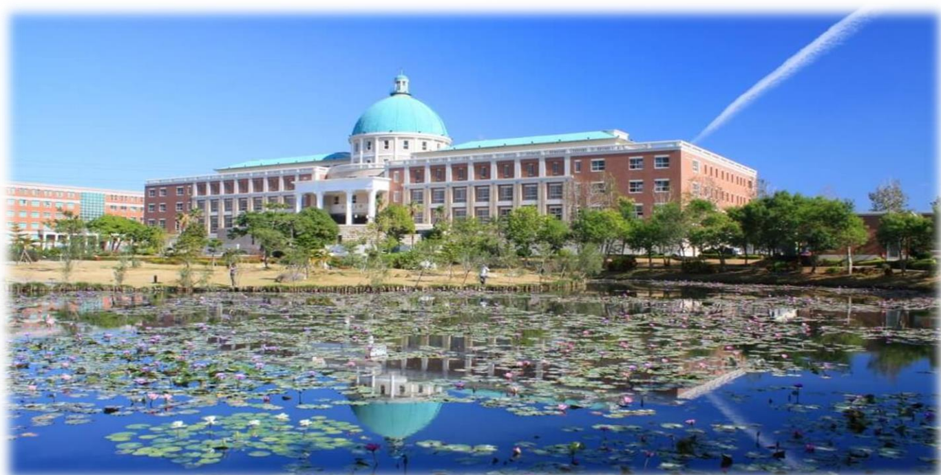
圖：就讀亞大，就是就讀一所「綜合大學」+「醫學大學」+「國際大學」